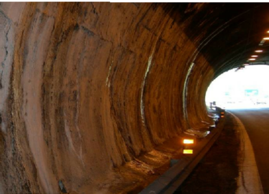
Danno B1: Presenza di acqua, fessure bagnate, puntuali