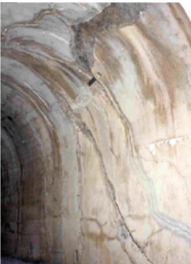
Fessure strutturali inclinate dovute alla spinta dei terreni sui rivestimenti