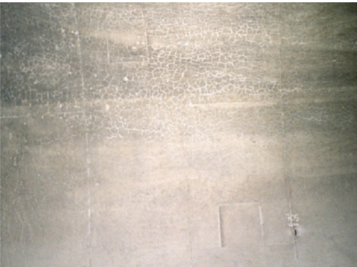
Fessurazione superficiale a maglia