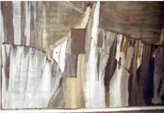
Fessurazione da ritiro