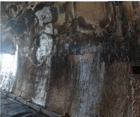
Danno B2: Presenza di acqua, fessure bagnate, diffuse