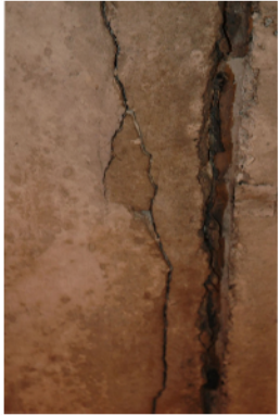
Fessurazione in adiacenza ai giunti costruttivi tra i conchi di getto