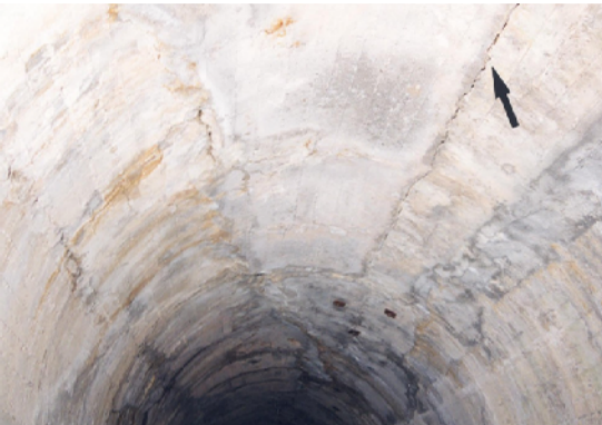
Fessure strutturali longitudinali dovute alla spinta dei terreni sui rivestimenti