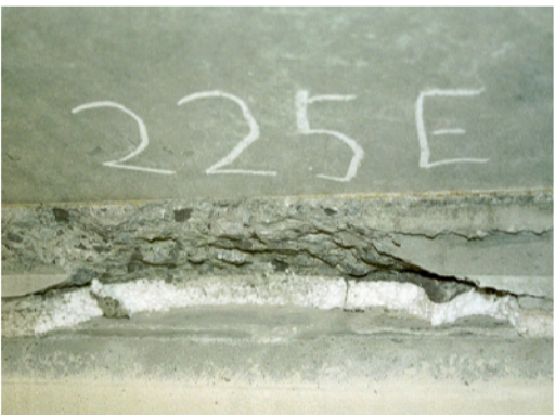
Espulsione del rivestimento agli angoli per accumulo tensioni

NOTA - IN OGNI CASO VANNO INDAGATE LE CAUSE CHE HANNO GENERATO LA FORMAZIONE DELLE FESSURE E CONSEGUENTEMENTE PROVVEDERE ALLA RIMOZIONE DELLE STESSE