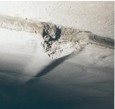
Deformazioni puntuali del getto del rivestimento