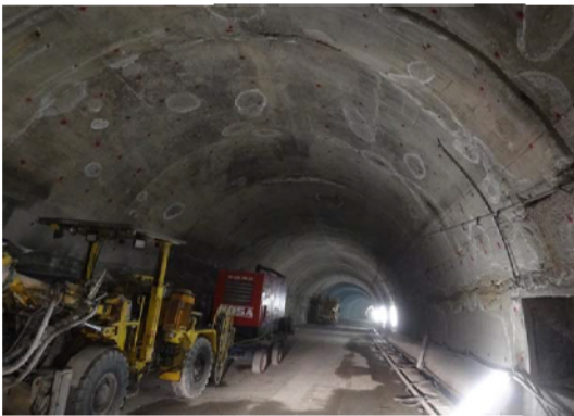
Danno A1: Assenza di acqua, fessure di piccola entità