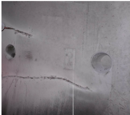
Danno A2: Assenza di acqua, fessure di larghezza maggiore