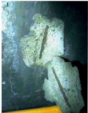
Espulsione rivestimento dovuto a corrosione dei ferri di armatura