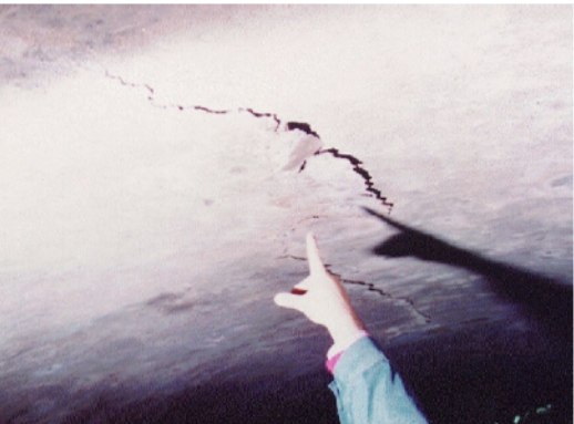
Espulsione rivestimento in calotta o ai piedritti dovuto a carichi di compressione