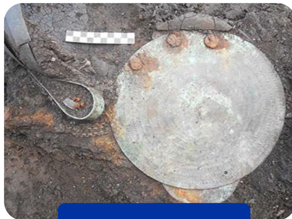
Principessa di Plestia