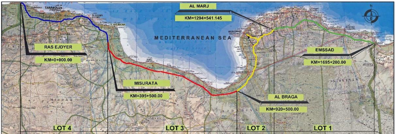
Autostrada Ras Ejdyer-Emsaad – Lotti 1, 2, 3, 4